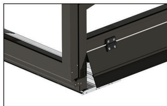
Belüftungsklappe gegen Aufpreis