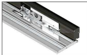
Abschnittsverriegelung Abschnittsverriegelung gegen Aufpreis