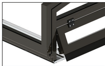
Aufklappbare Vorderseite gegen Aufpreis